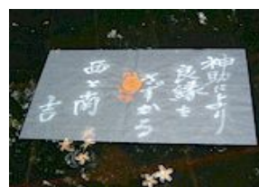
「鏡の池」に和紙に硬貨を乗せて池に浮かべ、和紙が沈むまでの距離と時間で待ち人がいつ現れるかを占います。