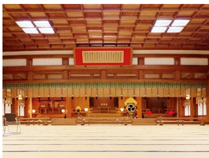
写真：天理教高知大教会内部