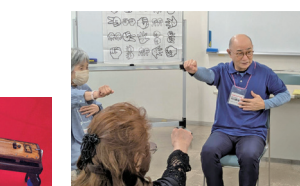
12/16 楽しく笑って脳イキキ教室