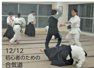
12/12 初心者のための 合気道